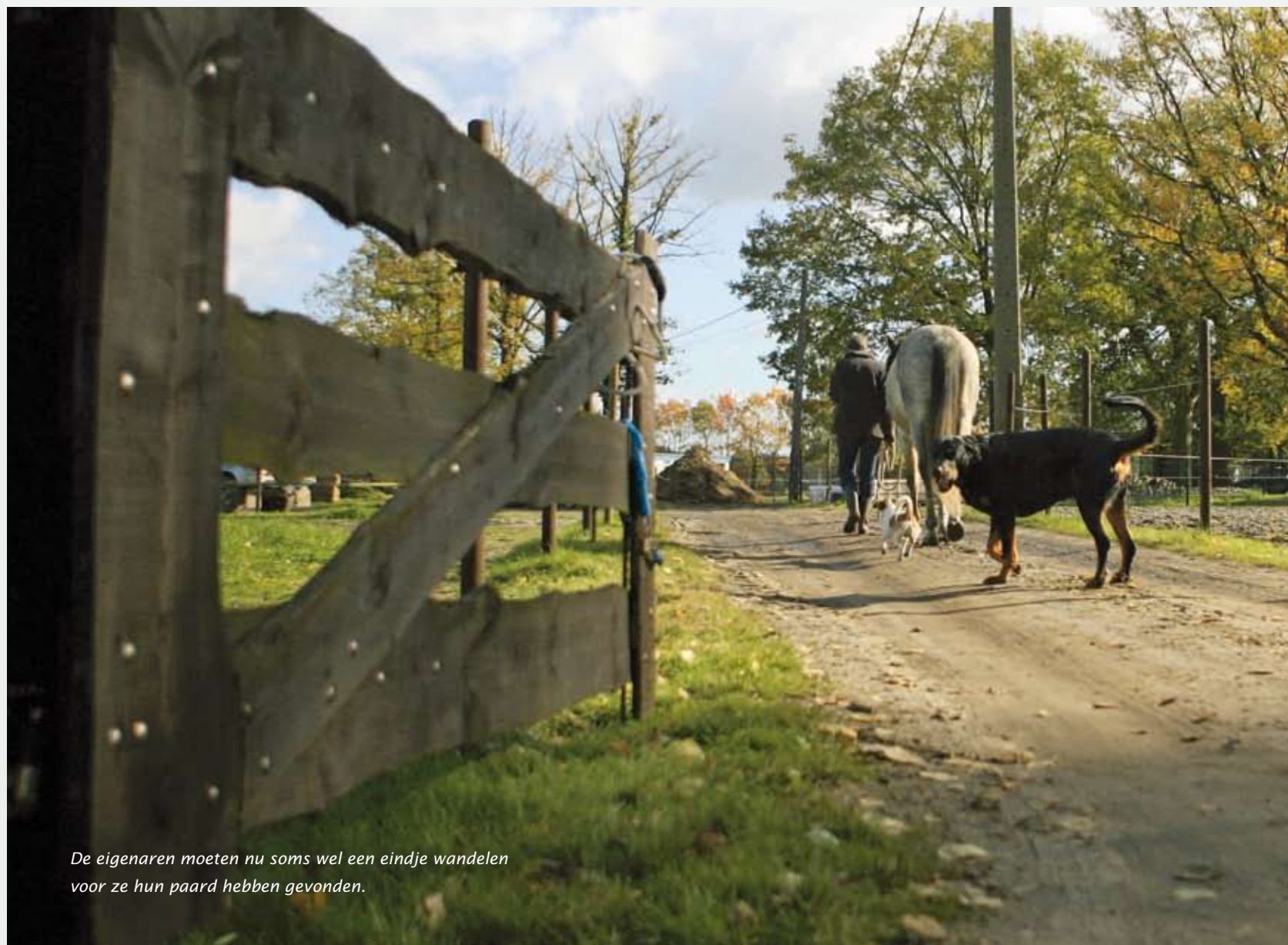
De eigenaren moeten nu soms wel een eindje wandelen voor ze hun paard hebben gevonden.