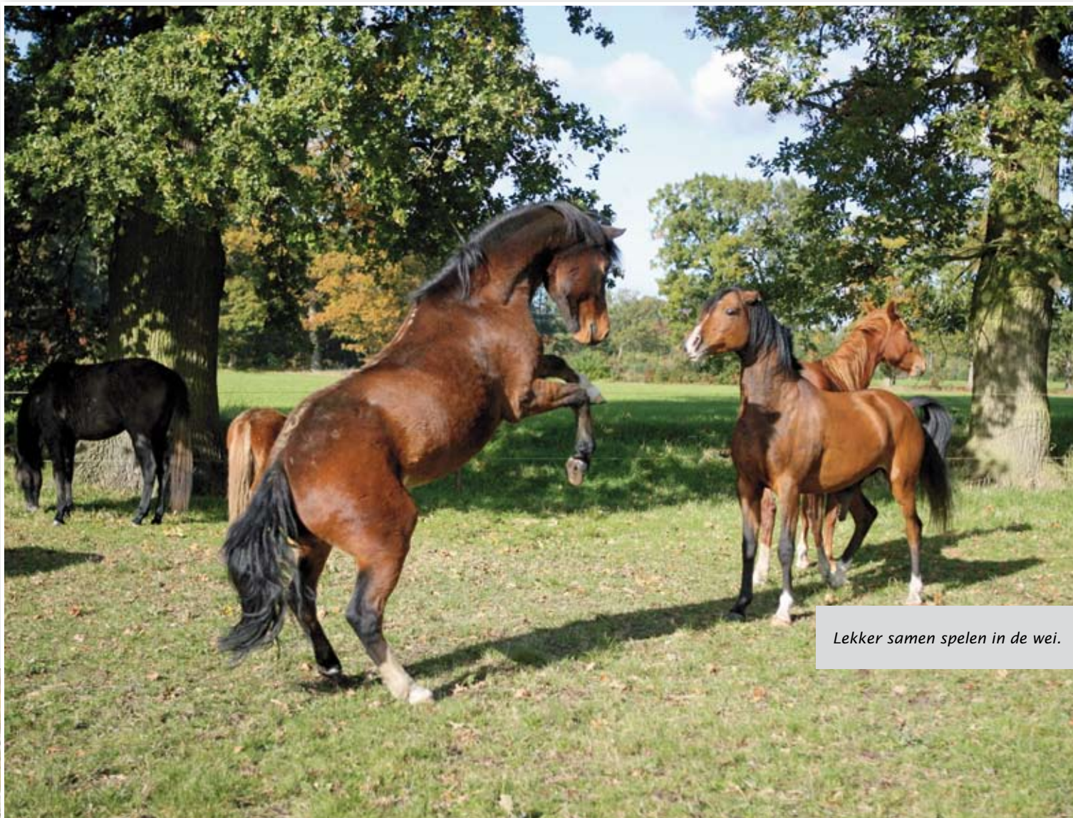
Lekker samen spelen in de wei.