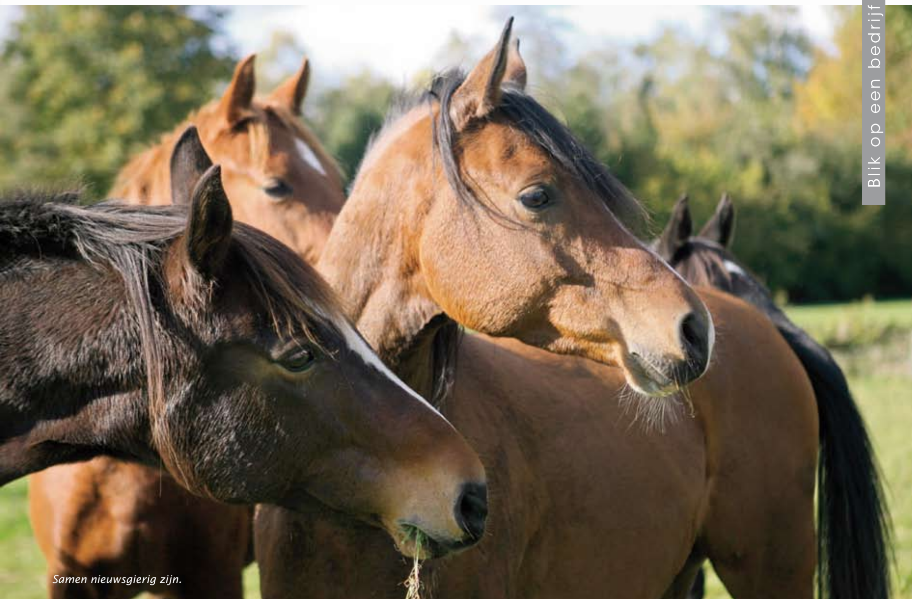
Samen nieuwsgierig zijn.