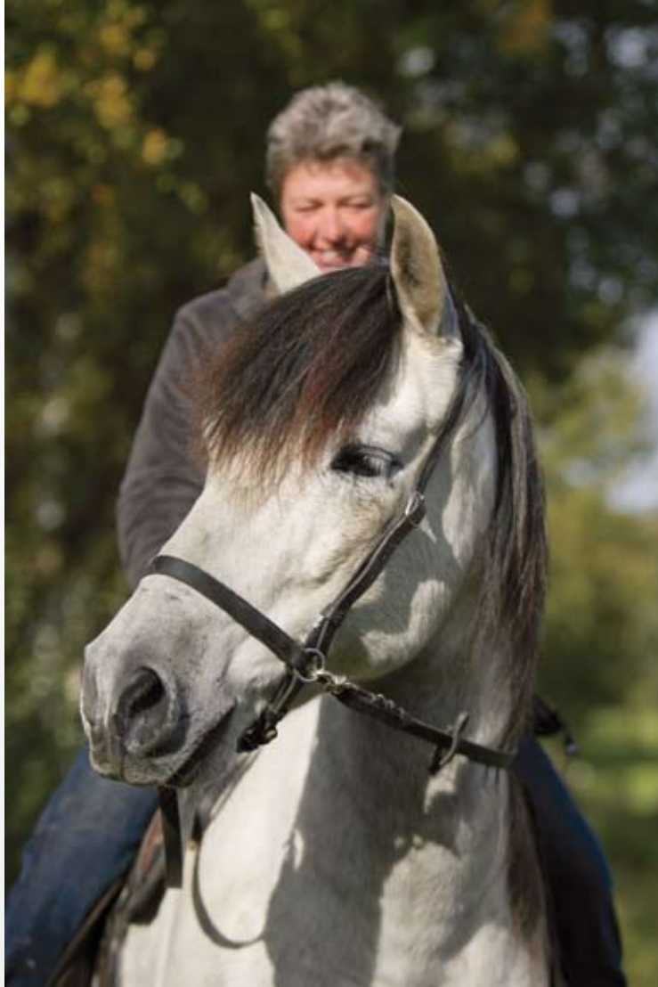
Iedereen die zijn paard bij De Poedertoren heeft staan rijdt bitloos en is verplicht zijn paard zonder ijzers te laten staan.

Linda vertelt: “In de zomer zetten we verspreid over ons domein verschillende weides open en kunnen ze zelf zoeken waar ze willen eten. Elke dag opnieuw moeten ze zichzelf de vraag stellen: waar is ons eten vandaag te vinden? Zo geven we de paarden op de Poedertoren de kans om hun natuurlijke behoefte aan beweging uit te leven en is er veel meer sociale interactie.”